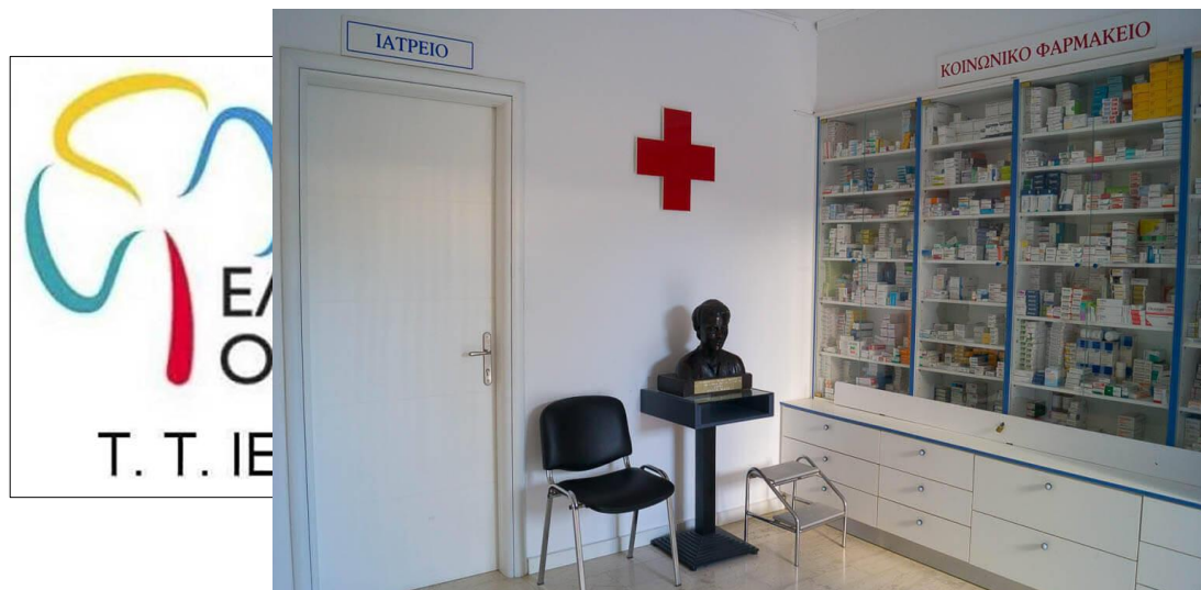
Το Κοινωνικό Ιατρείο- Φαρμακείο Ιεράπετρας-Ελληνικός Ερυθρός Σταυρός.